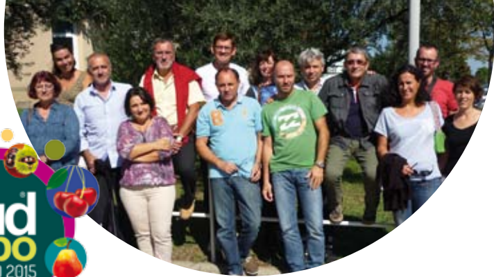
Le Réseau SudArbo® un partenariat dynamique.