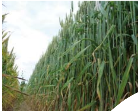
Exploitation de blé tendre.