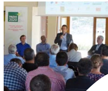
Réunion du territoire de Montpellier- Petite Camargue autour de Jérôme Despey, Président de la Chambre d'agriculture de l'Hérault.

www.herault.chambagri.fr/menu-horizontal/projet-agricole-departemental.html