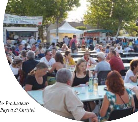
Marché des Producteurs de Pays à St Christol.

Vous souhaitez adhérer ? Contact : fpgsud@gmail.com