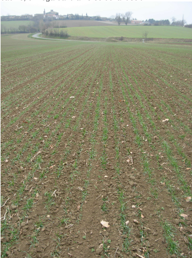
blé tendre à J+3 du passage de herse étrille à 3 feuilles.

Après les gels, le sol est souvent « soufflé ». Il faudra veiller à ne pas trop travailler en profondeur pour que le recouvrement soit partiel, surtout en sol limoneux. La situation s'observe du champ et non pas de la cabine, en regardant la herse devant soit.