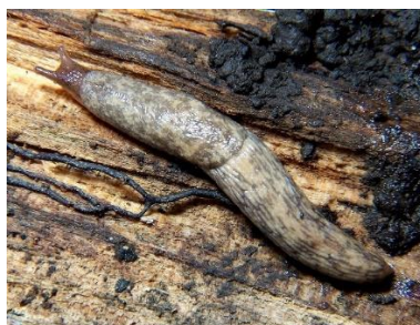
Limace grise ou loche Deroceras reticulatum Mesure 4 à 5 cm Couleur beige à brun Pontes en oct-nov puis avr-mai