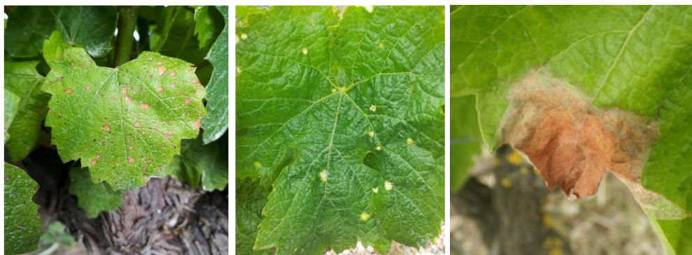
De D à G: Phytotoxicité d'épamprage chimique (CA81) ; Dégâts de désherbant (CA82) ; Tâche de botrytis (CA81)

A cette période, des symptômes de brûlure du feuillage liés à la dérive de produits désherbants peuvent apparaître. Ces taches sont plutôt d'aspect chlorotique et se distinguent des contaminations de black-rot par l'absence de liseré brun sur le pourtour de la tache. Afin de confirmer de manière formelle un symptôme de black-rot, il faut attendre l'apparition des pycnides (petits points violets) à la surface des taches soit en laissant la feuille au champ, soit en la mettant en chambre humide.