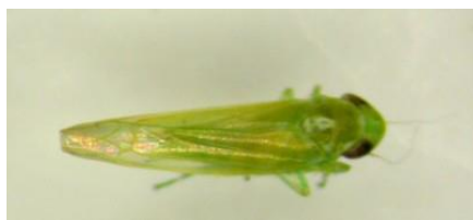
Adulte de cicadelle verte – IFV

L'application d'argile comme barrière physique est à mettre en place