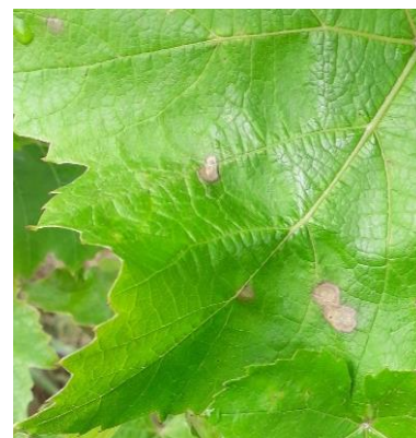
Tâches récentes de black-rot.

Surveillez le risque de pluie, des contaminations sont possibles. Restez très vigilants sur l'ensemble des parcelles.