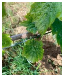
Carence en potasse

Présence de symptômes sur sol argilo-calcaire.