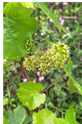
De gauche à droite : Stade 15 : boutons floraux agglomérés sur Mauzac. / Stade 17 : boutons floraux séparés sur Fer Servadou / Stade 20 : Début floraison sur Gamay