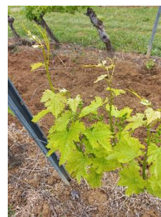
Chlorose ferrique _ photo CA81