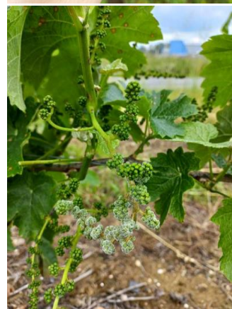
Tâches de mildiou et mildiou sur inflorescence