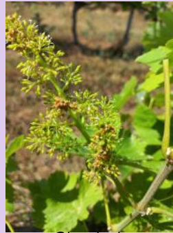
Glomérules sur inflorescence

(Avec confusion sexuelle: 5 inflorescences avec au moins un glomérule pour 100 inflorescences, si votre comptage porte sur 50 grappes le seuil est dépassé à partir de 3 grappes colonisées).