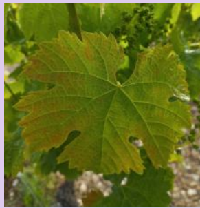
Carence en potasse sur Merlot