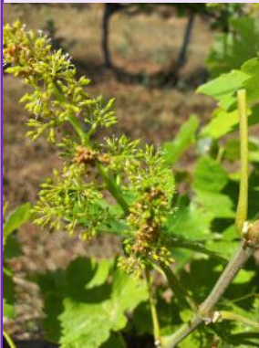
Glomérules sur inflorescence (Ph: CA81).