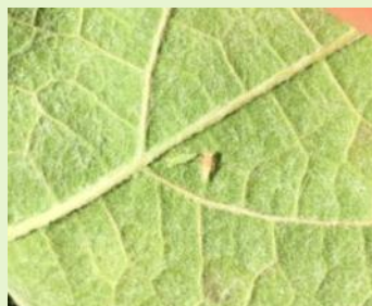
Larves de cicadelle verte

La gestion du ravageur repose sur une surveillance des populations larvaires. A ce jour, les populations sont très faibles, le risque est donc nul.