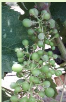
Oïdium sur jeune grappe

Les symptômes progressent sur feuilles et sur grappes sur un témoin non traité à historique. Au vignoble aucun symptôme n'a été signalé pour le moment.