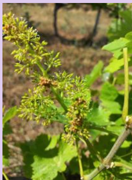
Glomérules sur inflorescence

Les comptages de glomérules montrent un niveau de pression en G1 faible à modéré.