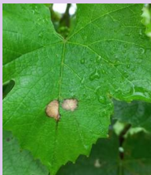
Tâches avec picnides

Des pluies sont annoncées en fin de semaine, un risque de contamination est possible.