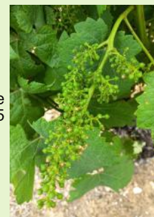
Duras stade "grains de plomb"

Sur les parcelles gelées les entre-cœurs sont au stade "7-8 feuilles" et les contre-bourgeons sont au stade "5 à 6 feuilles/ grappes agglomérées".