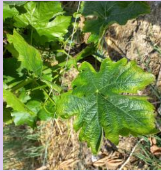
Carence en potasse sur Loin de l'oeil