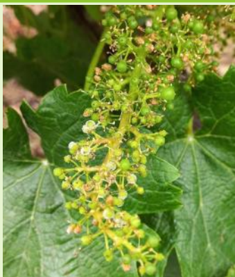
Rot gris à nouaison

Les symptômes progressent sur feuilles et surtout sur grappes dans les témoins non traités. Au vignoble, quelques nouveaux symptômes sont ponctuellement signalés. Dans la majorité des situations, le mildiou est bien contrôlé.