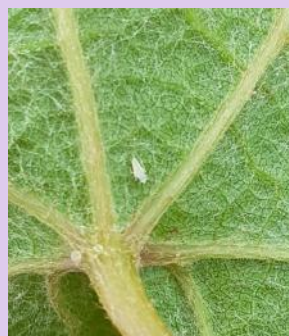
Larve L1 de cicadelle de la flavescence dorée

* Vivitrine Ew , deltaméthrine 0,5L/ha (3 applications max), ZNT=20m